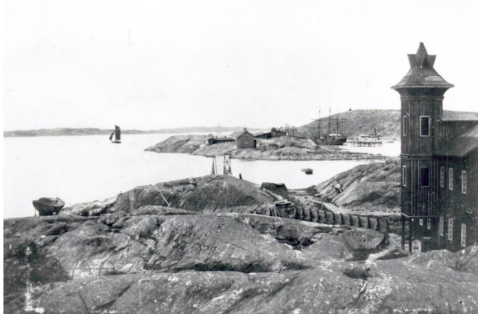
Foto från cirka 1900, taget från Stora Varholmen mot Bockeskär och Lilla Varholmen. I bildens mitt uppfordringsverket på bryggan. I bakgrunden silsalteribyggnader på Bockeskär.

upp utmed kusten under denna Torslanda sockens största glansperiod genom tiderna.