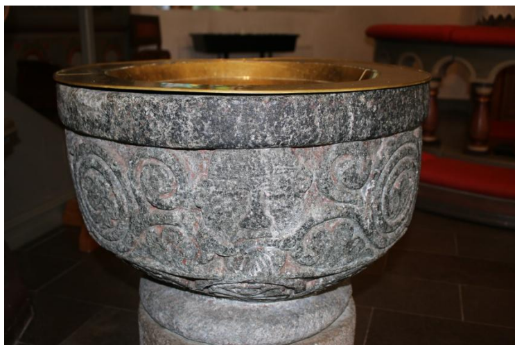
Dopfunten som den ser ut idag

1658 övergick Bohuslän och därmed Torslanda socken från norsk ägo till Sverige, efter freden i Roskilde.